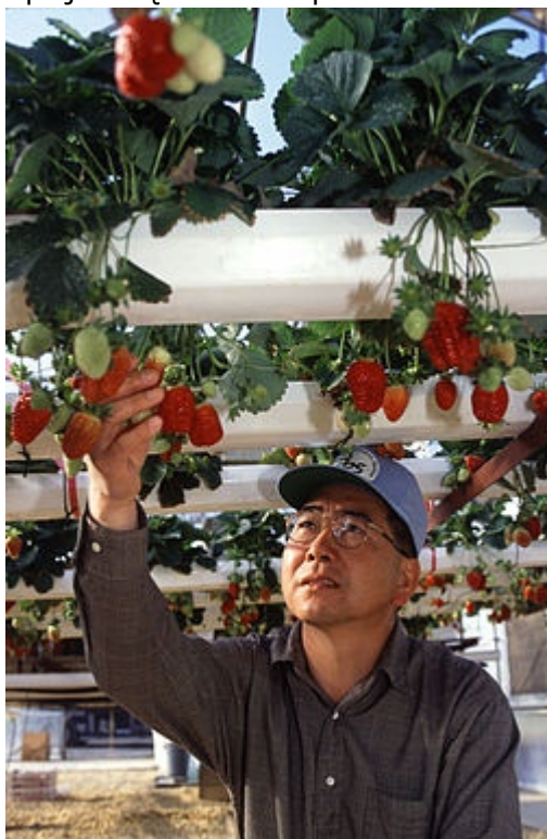
1. Hydroponiczna uprawa truskawki

Obecny stan wiedzy technologicznej w zakresie produkcji żywności wystarczy nam na najbliższe pół wieku swobodnego rozwoju. Dziś na świecie żyje 7 mld ludzi. Dzisiejsze rolnictwo byłoby w stanie wykarmić 12 mld ludzi. Ukryty potencjał rozwoju żywnościowego mieści się właśnie w naszym regionie, dokładnie na Ukrainie, gdzie są słabo zagospodarowane najlepsze gleby świata; lepiej zarządzana Europa Środkowa może spokojnie pretendować do roli spichlerza świata.