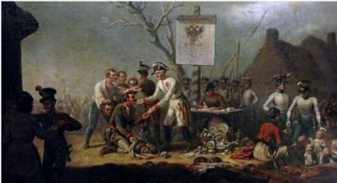
"Rzeź galicyjska" - obraz Jana Nepomucena Potockiego fot. Wikimedia Commons.