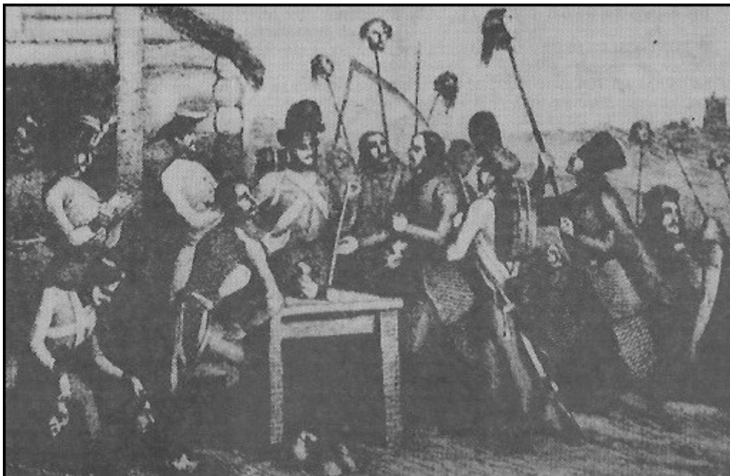
Horror w Galicji: Austriacy płacą chłopom za głowy polskiej szlachty

Scytyjska bestia została w samym sercu Polski obudzona polityką austriacką i niedostatkiem wyobraźni w ówczesnej elicie intelektualnej Polski. Oby nigdy więcej nie zabrakło nam tej wyobraźni. Dlatego nie bójmy się sięgać po praktyczne lekcje płynące z Auschwitz. Cieszę się, że są w Polsce Żydzi, którym wyobraźni nie blokuje polityczna poprawność.