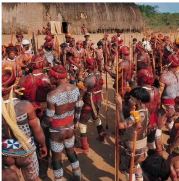
Indianie brazylijscy z dżungli Kamajuras i Nawras, MNEP PWN 2000