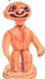
Wizerunek boga (Płn.-zach. Ameryka)