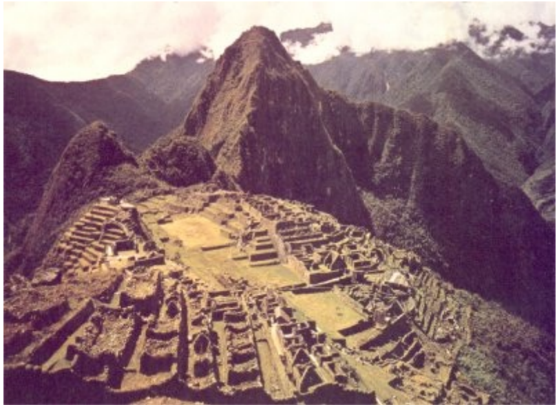
Ruiny Machu Picchu, 'zaginione miasto' Inków położonego 80 km na północny zachód od dzisiejszego Cuzco. Opuszczone przez Indian po inwazji hiszpańskiej. Świat wiedzy