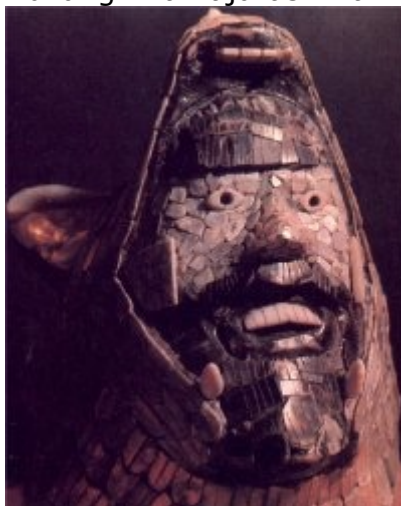
Głowa boga Quetzalcoatl ukazująca powstanie tegoż bóstwa z czeluści ziemskich