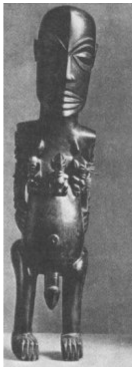
Bóg Te Rongo z trzema synami. Drewniany idol z wyspy Rarotonga (Archipelag Cooka), Polinezja

Bardziej dojrzałą religię mieli Drewniane figurki przodków. Z lewej — Nowa Polinezyjczycy (pierwotni Gwinea (Melanezja), po prawej — Wyspa mieszkańcy wysp Polinezji, Wielkanocna (Polinezja) pochodzenia austronezyjskiego, zamieszkujący umowny trójkąt między Hawajami, Wyspą Wielkanocną i Nową Zelandią) i Malezyjczycy . Dominowały różne tabu (pojęcie tabu jest pochodzenia polinezyjskiego). Wierzyli w Boga-Stwórcę, posiadali swoje legendy o początku świata (złowionego w morzu lub wyklutego z jaja). Obowiązkowe dla mężczyzn jest tatuowanie , które jest oznaką przymierza z bogiem szczepu.