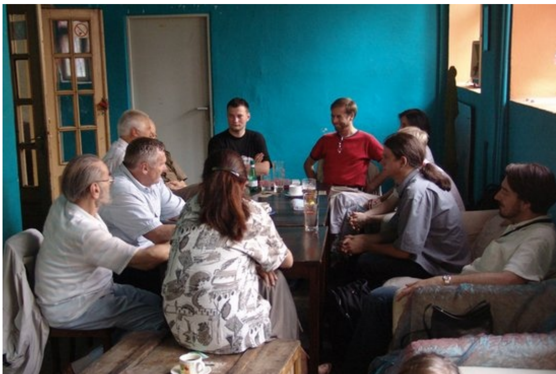
Na parterze Le Madame, przygotowania do zebrania.