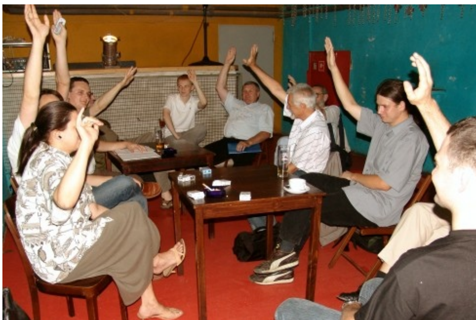
Głosowanie jeszcze metodą bardzo tradycyjną...