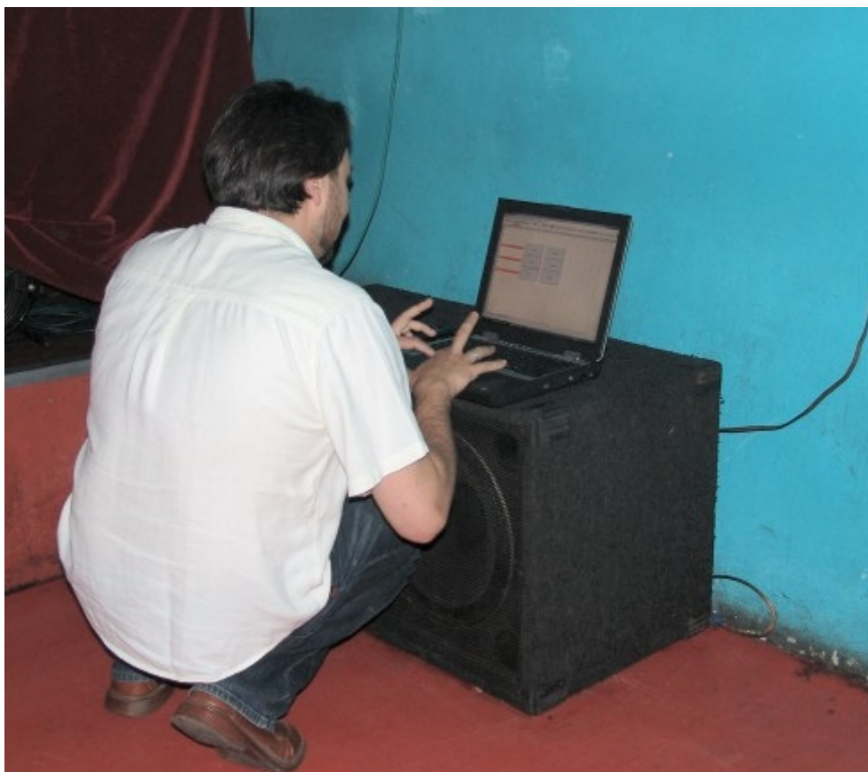
A tutaj głosowanie bardziej nowoczesne...