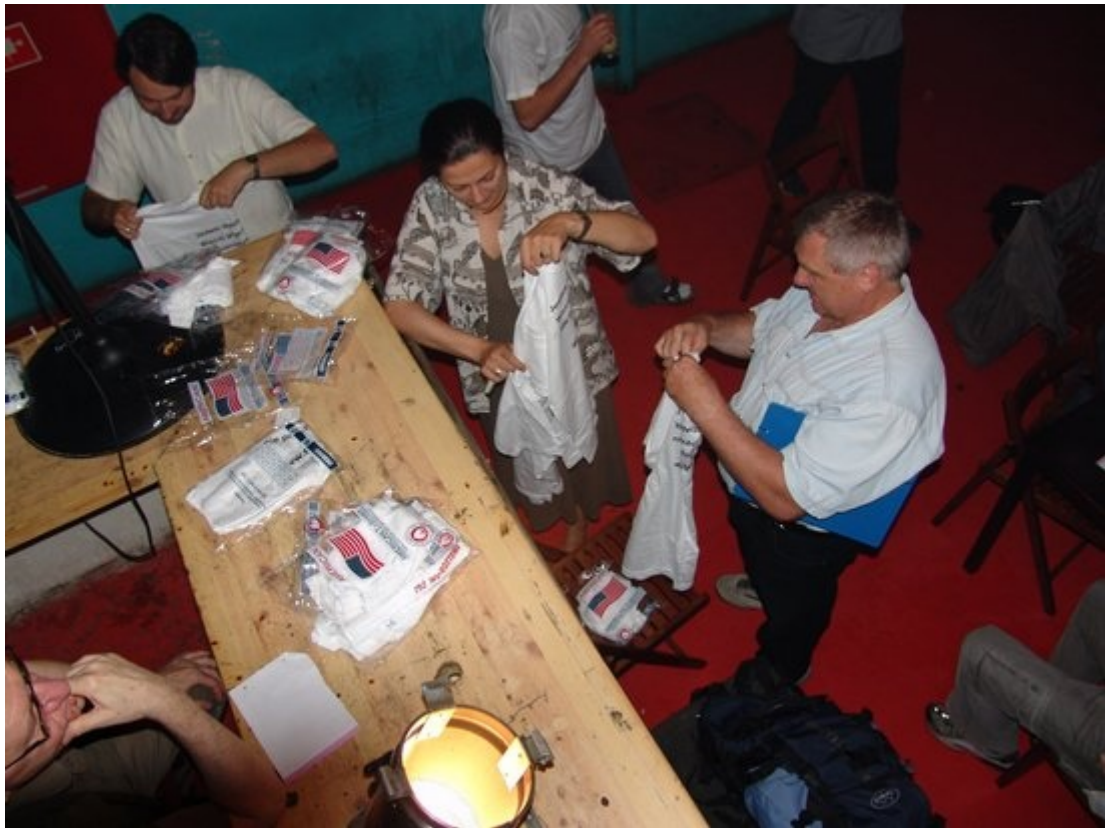
Wspólne mierzenie koszulek racjonalistyczno-pe-es-er-owych zakończyło nasze spotkanie...