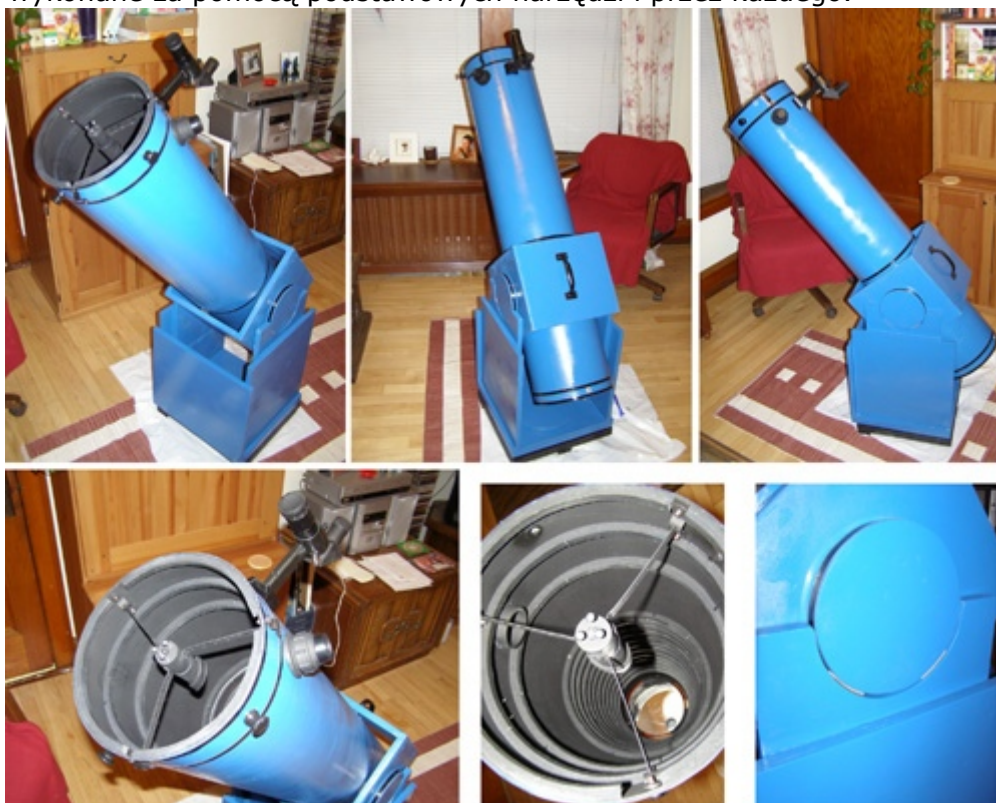
Rycina 2. Oto LEM , teleskop newtonowski na podstawie Dobsona o średnicy zwierciadła 203 mm oraz światłosile f/5.8 (nazwany ku pamięci Stanisława Lema). Budowa teleskopu tak naprawdę nigdy się nie kończy - zawsze są jakieś pomysły, aby go usprawnić i udoskonalić.

Teleskop newtonowski, zwany również reflektorem, to obecnie najbardziej popularny rodzaj teleskopu, który do skupiania promieni używa wklęsłego zwierciadła na spodzie tubusa. Promienie od niego odbite, docierają do zwierciadła wtórnego, skąd kierowane są do okularu, przez który patrzy obserwator. Okulary można wymieniać, ustawiając tym samym odpowiednie powiększenie i pole widzenia. Reflektory są relatywnie tanie w przeliczeniu na aperturę w porównaniu z refraktorami – teleskopami zbudowanymi z soczewek. Przede wszystkim jednak mogą być wykonane za pomocą podstawowych narzędzi i przez każdego.