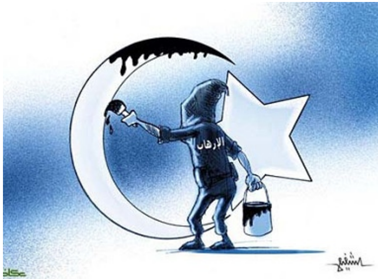
„Okaz" (Arabia Saudyjska), 29 sierpnia 2009 Terroryzm, rękami ociekającymi krwią, czyta Koran do góry nogami