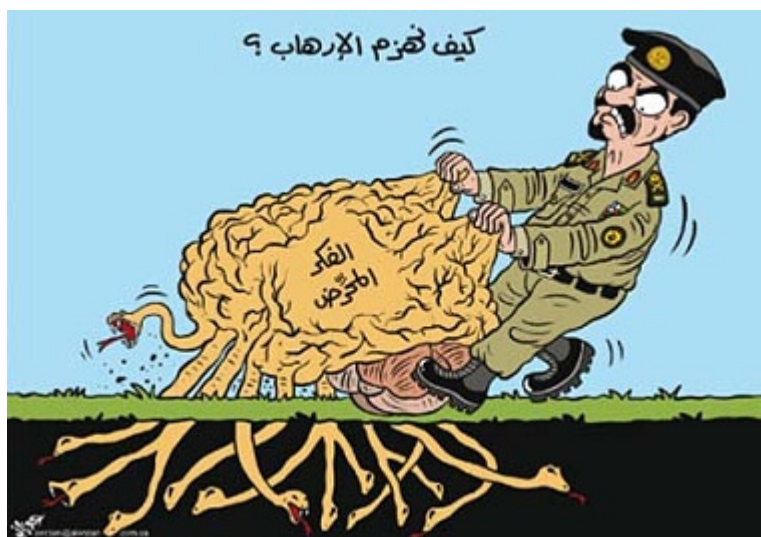
„Al-Watan" (Arabia Saudyjska), 30 sierpnia 2009 Karykaturzysta: Jihad Awartani Ekstremizm jest „Ideologicznym koniem trojańskim"