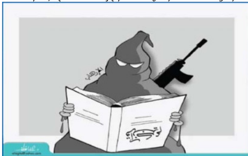
„Al-Madina" (Arabia Saudyjska), 30 sierpnia 2009 Karykaturzysta: Alaa Al-Laḡta