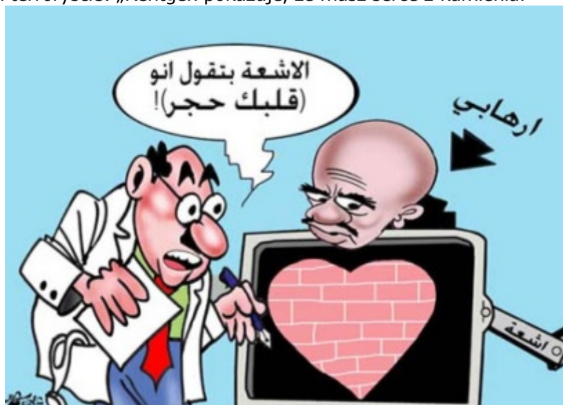
„Al-Nadwa" (Arabia Saudyjska), 3 września 2009 Karykaturzysta: Adel Said