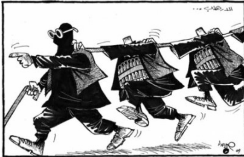
„Al-Hayat" (Londyn), 3 września 2009 Karykaturzysta: Habib Haddad Ulotki zawierające oskarżenia o herezję zakrywają terrorystę oczy i blokują mu uszy