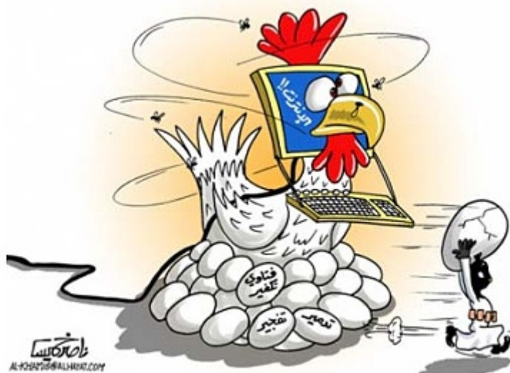
„Al-Hayat" (Londyn), 5 września 2009 Karykaturzysta: Nasser Khamis