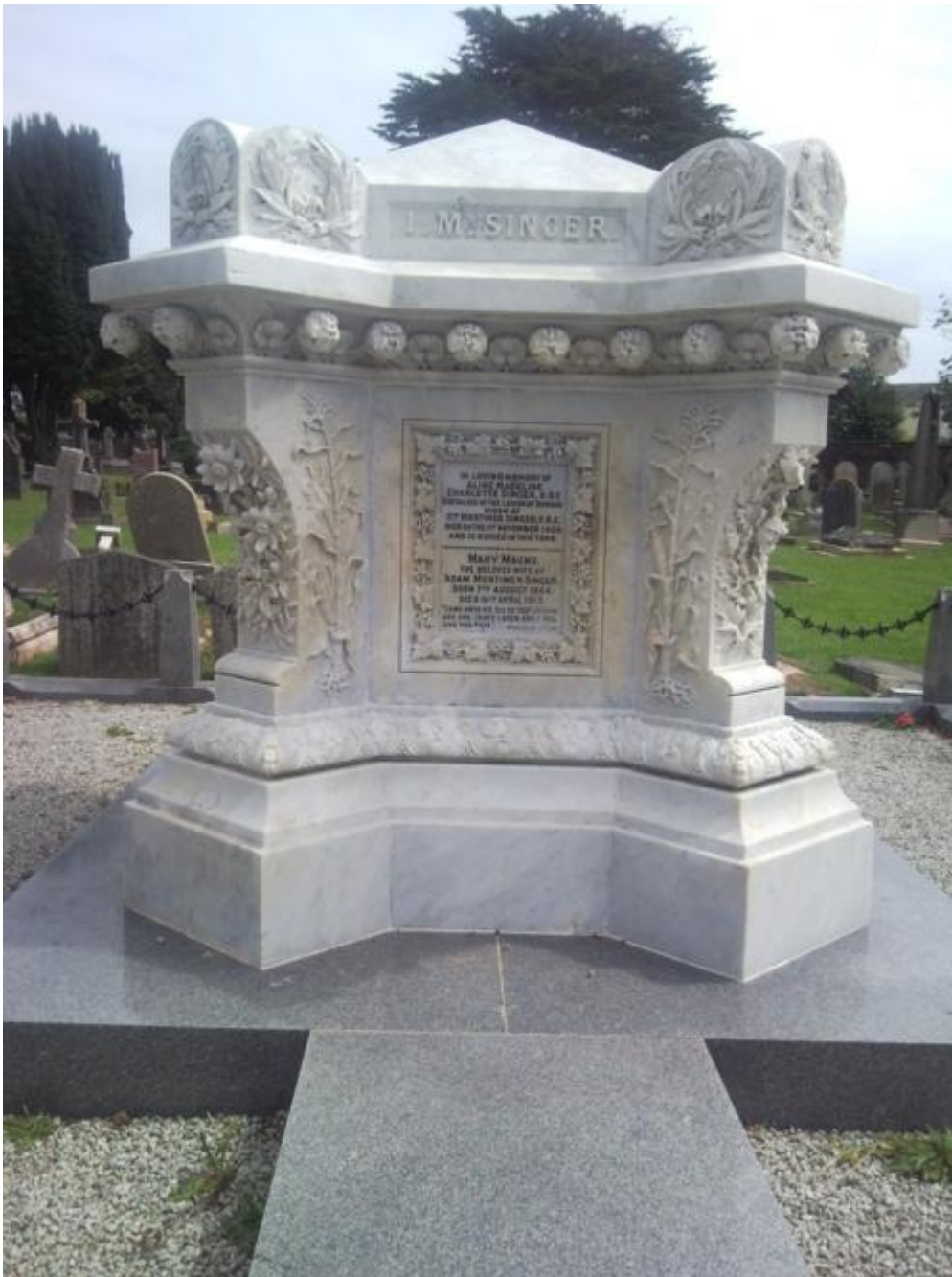
Dumnie przez życie, dumnie — po śmierci