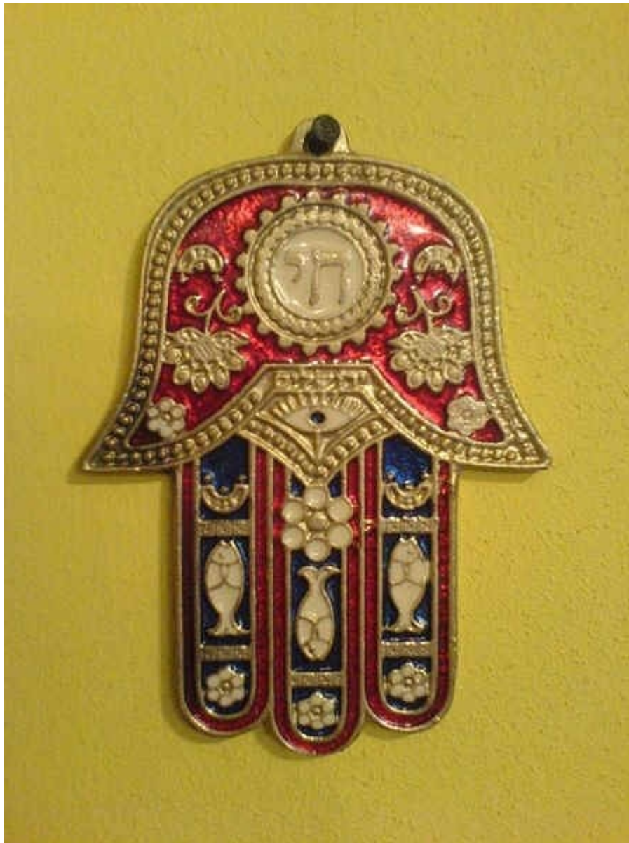
Żydowski odpowiednik „Ręki Fatimy” — „Ręka Miriam”.

Od najdawniejszych czasów ludzie tworzyli coraz to nowe środki mające na celu neutralizację mocy „ złego oka”. Uchronić od złego spojrzenia miało plucie (ten obyczaj, który narodził się w starożytnej Grecji i jest kontynuowany po dziś dzień), równie często w tym samym celu stosowana była mundza .