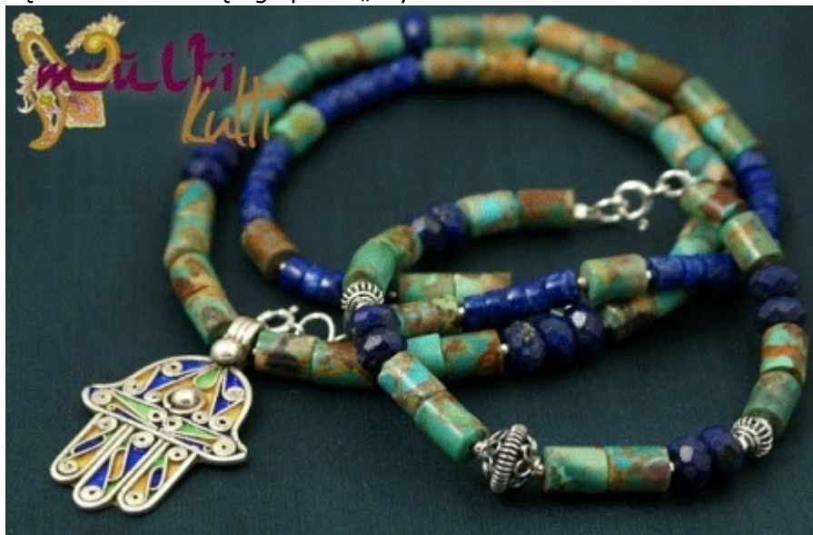
"Ręka Fatimy" z umieszczonym w centralnej części okiem.

„ Ręka Fatimy" jak nazywają to muzułmanie, względnie „ ręka Miriam" jak nazywają to Żydzi, pełni również rolę amuletu chroniącego przed „ złym okiem".