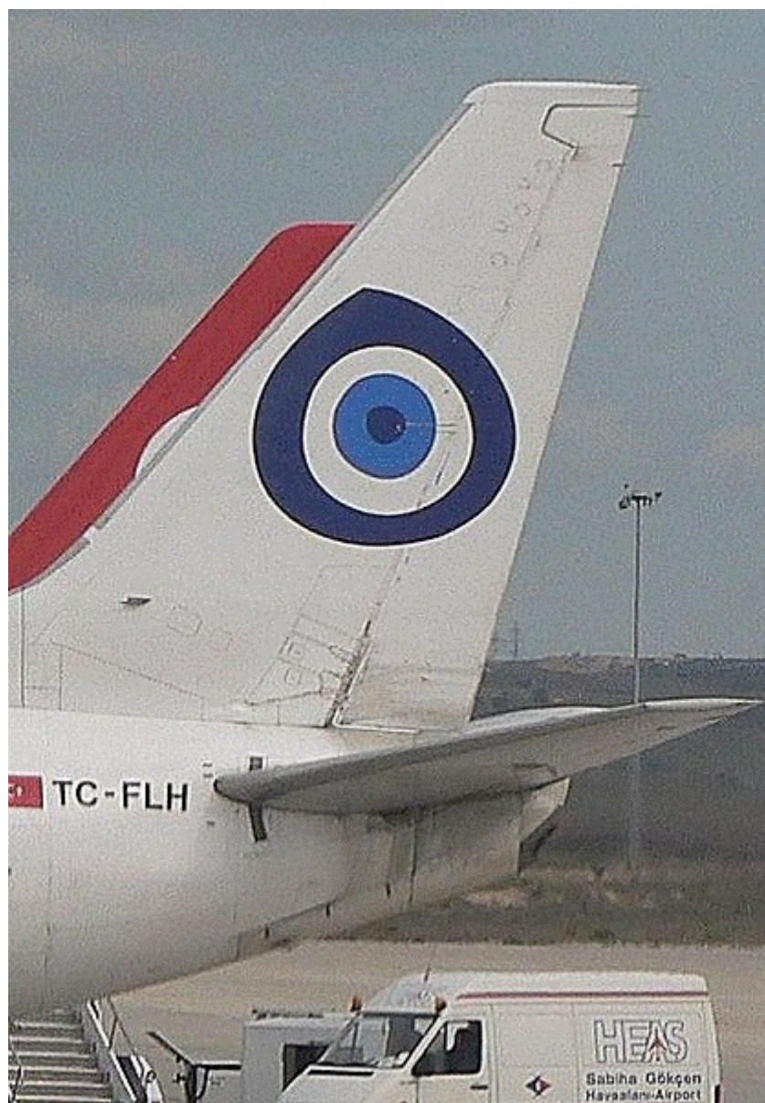
Błękitne oko jako amulet tureckich linii lotniczych.