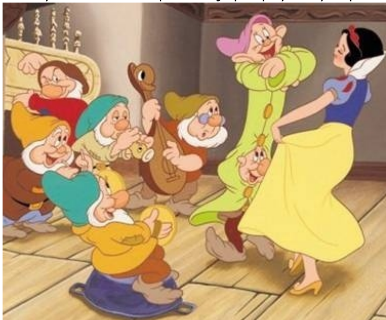
Apoteoza zabawy w scenie tańca Królowny z Krasnoludkami

Bardzo czytelne są kolejne nieudane zapożyczenia z tradycji śnieżkańskiej. Zamiast Siedmiu Krasnoludków w mitologii chrześcijańskiej pojawia się Dwunastu Apostołów (wykorzystano symboliczną liczbę 12 bo przecież liczba 7 była już zajęta!). Apostołowie, podobnie jak Krasnoludki, są uczniami, którym nauczyciel ex cathedra przekazuje przepisy na życie po śmierci. Cóż za absurd!