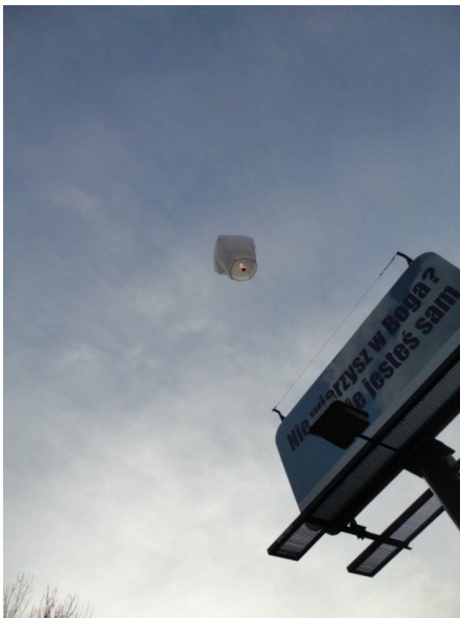
Billboardy zawisły wysoko. (Co gorsza, lampion ateizmu unosi się nad bilbordem.)