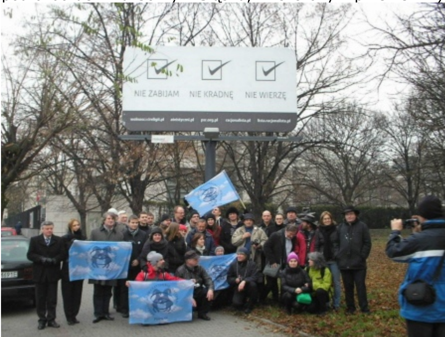
Ich przekaz był podobny: niewierzących jest wielu, a przyzwoitość jest bezwyznaniowa. (Delegaci PSR z całej Polski, oraz sympatycy pod billboardem ateistycznym w Warszawie.)