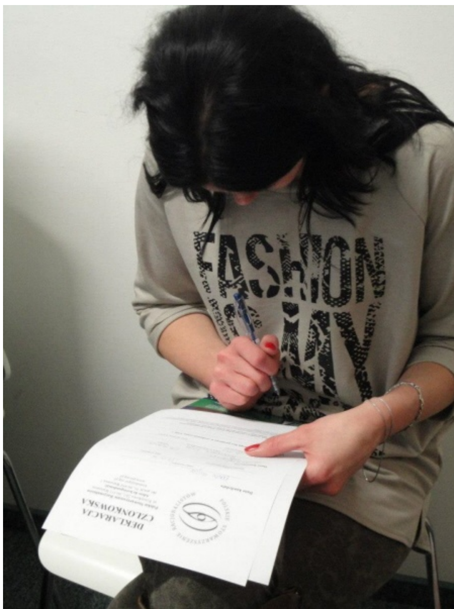
Autorka tekstu w akcji.