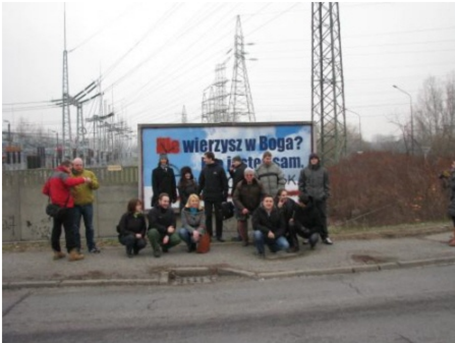
I nieco niżej (Spotkanie PSR Katowice i sympatyków pod billboardem na Górnym Śląsku, zniszczonym przez ONR.)