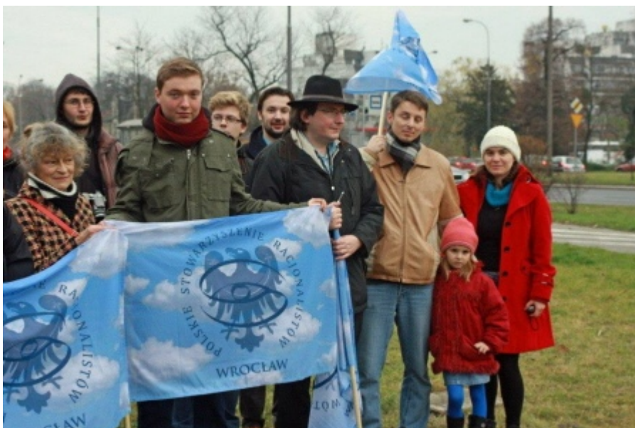
Spotkanie PSR i sympatyków pod billboardem we Wrocławiu.