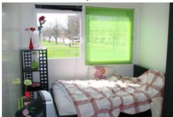
2. Pokoik w studenckim kontenerze mieszkalnym

Mieszkalnictwo kontenerowe nie ma jednak w Holandii negatywnych konotacji, gdyż kojarzy się przede wszystkim ze studentami. To dla studentów głównie rozwija się ta dziedzina budownictwa, w oparciu o ten materiał stawiane są nawet całe skomplikowane miasteczka studenckie. Studenckie mieszkalnictwo kontenerowe: Wonen in een container, helemaal zo gek nog niet ( http://www.studenten.net/lifestyle/lifestyle/16842/wonen_in_een_container_helemaal_zo_gek_nog_niet ). Przykład miasteczka studenckiego z 500 kontenerów: Studenten in bijzondere huurwoningen ( http://www.huur.nl/huren/wonen/studenten_in_bijzondere_huurwoningen.asp ).