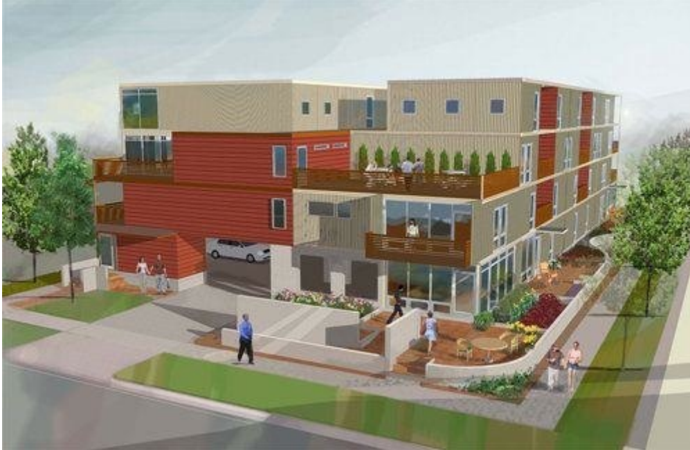
Kompleks mieszkalny z 93 kontenerów

Jest to trend obecny w wielu krajach zachodnich: www.containercity.com (http://www.containercity.com) www.architectureandhygiene.com (http://www.architectureandhygiene.com) Lego dla dużych chłopców (http://www.lowtechmagazine.be/2006/06/lego-voor-grote.html) Containerbay (http://www.fabprefab.com/fabfiles/containerbayhome.htm) 8 eye-catching shipping container homes (http://www.mnn.com/your-home/remodeling-design/photos/8-eye-catching-shipping-container-homes/a-new-kind-of-living) 10 (More) Awesome Architectural Shipping Container Designs (http://weburbanist.com/2008/06/01/more-cargo-container-homes-and-offices/) Crate expectations: 11 shipping container housing ideas (http://www.mnn.com/your-home/remodeling-design/stories/crate-expectations-11-shipping-container-housing-ideas)