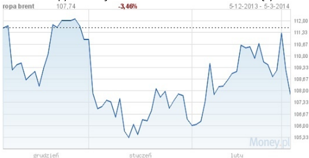
Kurs ropy naftowej w dolarach z ostatnich trzech miesięcy

Zdaniem eksperta, zakładając taki negatywny scenariusz, polskie rafinerie musiałyby kupować ropę z innych rynków, podczas gdy w tej chwili większość surowca jest importowana z Rosji. To spowodowałoby konieczność podniesienia cen, nie tylko ze względu na kurs ropy na rynku, ale również na to, że rafinerie musiałyby się dostosować do przerobu innych gatunków ropy.