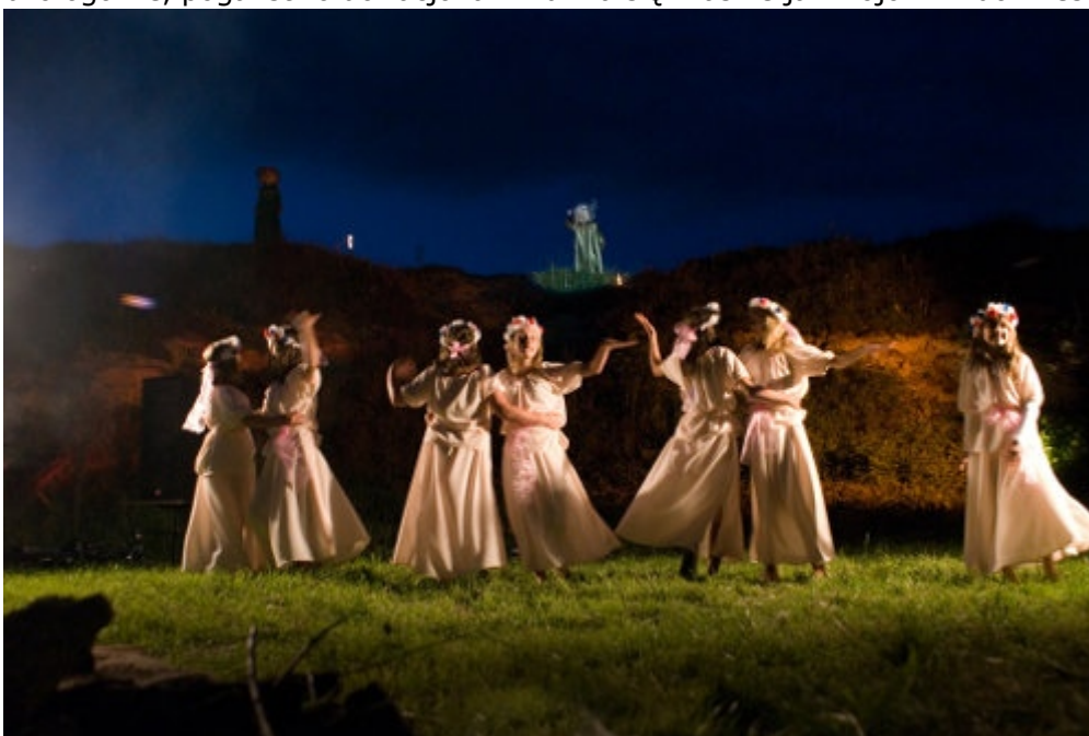
Noc Kupały nad zalewem pińczowskim

Rozumo-centryczny racjonalizm często powoduje skupianie się człowieka wyłącznie na sferze rozwoju intelektualnego. Pogaństwo w dużo większym stopniu i częściej zwracają uwagę również na fizyczność. Chodzi mi zarówno o dbanie o kondycję, czy tężyznę fizyczną (i uważanie jej za wartość samą w sobie), jak i na gotowość na fizyczną konfrontację (widoczna np. w popularności rekonstrukcji historycznej). Etos racjonalisty to etos mieszczanina. Etos poganina to etos wojownika. Mówiąc bardzo ogólnie, pogaństwo do racjonalizmu ma się właśnie jak wojownik do mieszczanina.