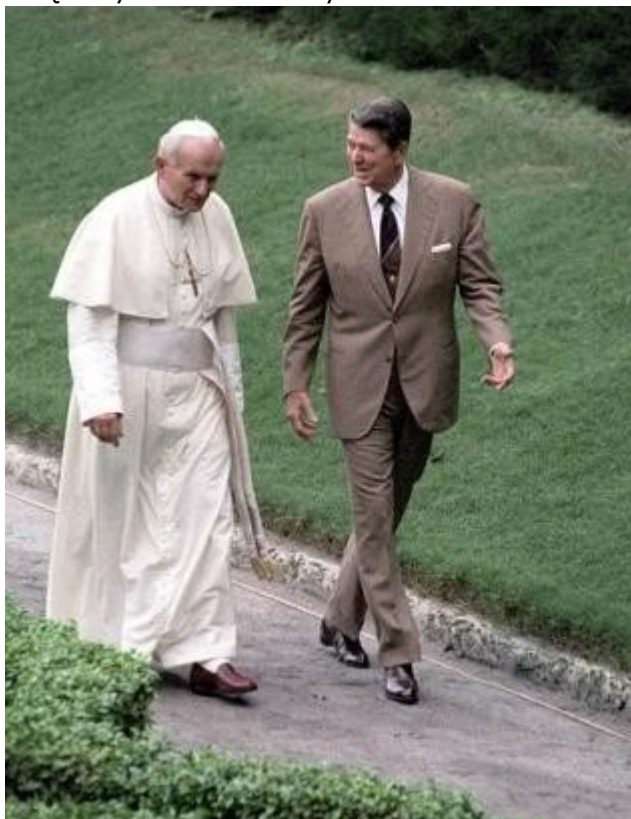
1. Wojtyła i Reagan — objęli władzę w tym samym czasie, obaj też byli w młodości aktorami: ten pierwszy teatralnym, ten drugi — filmowym

Innego zdania była przeważająca część polskiego parlamentu, która uznała, że święto religijne należy potraktować jednocześnie jako święto państwowe i ogólnospołeczne — przyjmując uchwałę, przygotowaną i zgłoszoną przez klub PSL, wzywającą całe społeczeństwo do „solidarnego świętowania” uroczystości kanonizacyjnych. Tymczasem polskie społeczeństwo tworzą także wyznawcy różnych innych religii i wyznań religijnych, światopoglądów, osoby bezwyznaniowe i niewierzące oraz pewna grupa zeświecczonych katolików, którzy nie przywiązują większej wagi do świąt i wydarzeń kościelnych.