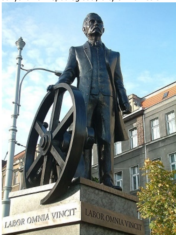
1. Pomnik Cegielskiego z inskrypcją „Praca zwycięża wszystko”

Wykastrowanie części tych tradycji zarówno w okresie PRL, jak i w III RP doprowadziło do zubożenia perspektywy historycznej. O ile w okresie PRL negowano doniosłość powstań w procesie odzyskania niepodległości, o tyle w okresie III RP rozwinęto kult powstań.