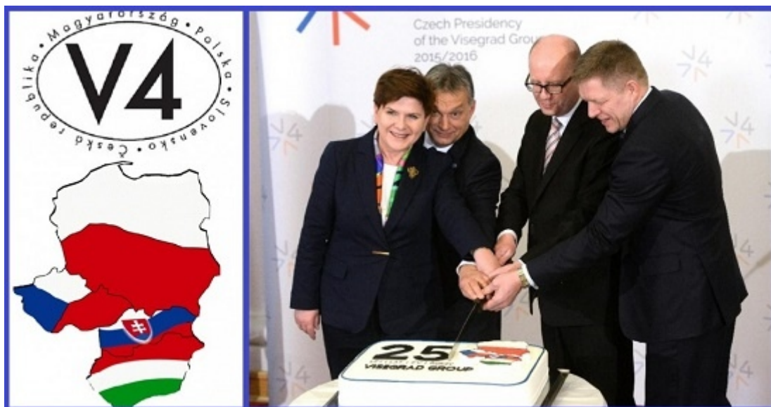
W tym miesiącu celebrowano 25-lecie Grupy Wyszehradzkiej

Polska póki co do zbliżenia z Rosją utrzymuje słuszny dystans, lecz gdyby doszło do tego, co zapowiadają geopolitycy, o możliwym porozumieniu Rosji i USA przeciw Chinom (najwcześniej pewnie po wyborach w USA), wówczas Polska naturalnie włączy się w taką geopolitykę.