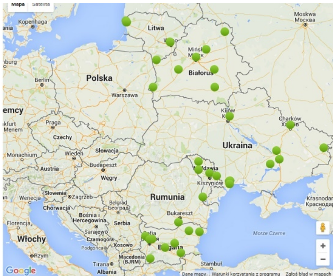
List of stations opened for VIKING Train